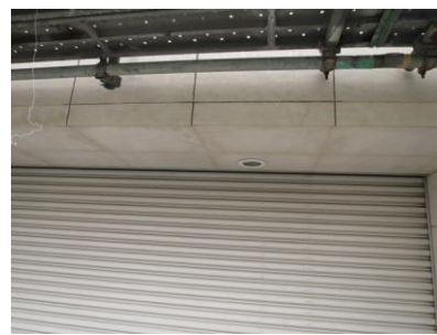
3. 2次洗浄(カビ抜き後)