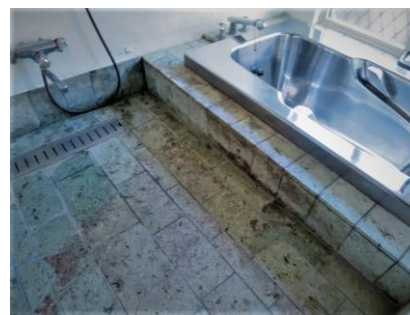
1. 全体的に黒くカビが発生

て仕上げます。カビを発生し難くするには、浸透性コートも有効なのですが、濡れると鮮やかな緑色が出なくなってしまうので、オーナー様との打ち合わせが必要です。