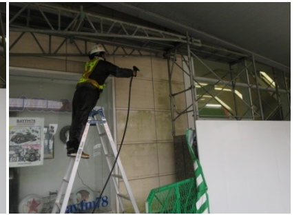
4. 高圧洗浄でカビを飛ばす