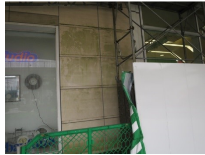
3. 洗剤塗布してカビを浮かす