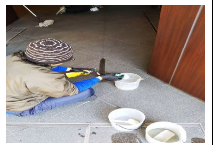
2. シミ部分を溶剤で抜いていく