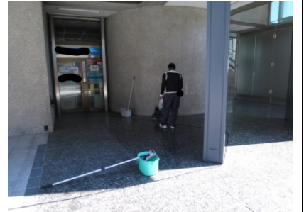
2. 洗剤塗布後ポリッシャー洗浄