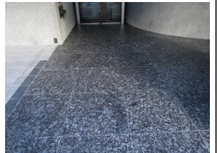
4. ウェットコート施工完了後