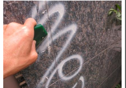
2. 出来るだけ物理的に除去する