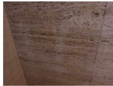
1. トラパーチン洗浄前

トにして汚れをかき出していきますと、トラパーチン本来 のベージュ色が蘇ってきました。