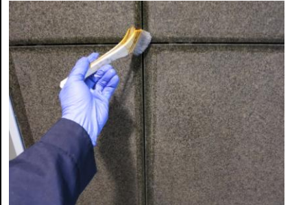
2. 目地へシミ抜き剤塗布