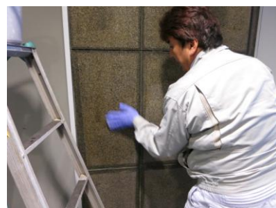
3. ヤニ取りの全体洗浄