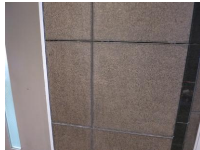
1. 目地のシミとヤニの複合汚れ

入ったヤニを取り除きます。自然乾燥させていくと、本来 のバーナー仕上げの下地が出てきました。