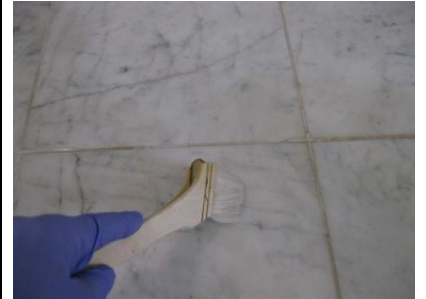
2. シミ抜き剤を塗布