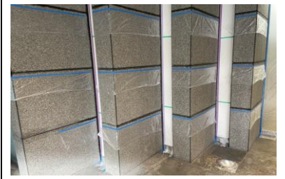
2. シミ抜き剤垂れ防止養生