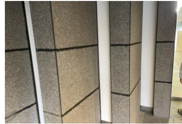
1. シール材からの濡れジミ

石を洗浄したので、隙間から水が入り込んでいるために、2～3日間ほど乾燥させてからシールの充填を行うのがよいと思います。