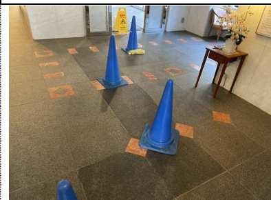
4. 動線確保してコート塗布