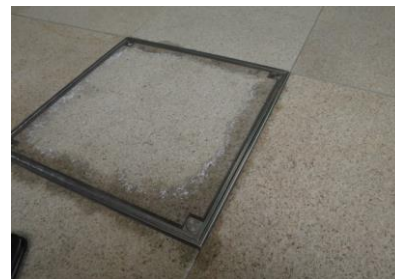
1. 点検口の目地回りの濡れ色シミ

のでシミ抜剤を塗布し、さらにバーナーで強制的に乾燥をさせ浸透性の吸収防止剤を塗布します。最後に濡れ色が再発しないように再度、バーナーを当てて完了しました。