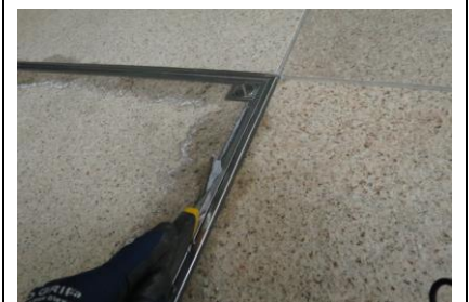
2. 回り縁のシール剤のカット