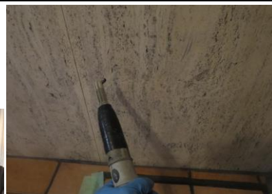
3. スチームですすぎ洗浄