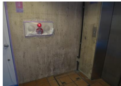
1. トラバーチンの汚れ

に漂白洗浄をして、こちら時間もかけてゆっくりと本来の下地を出していきます。石自体の経年による変色も少なくてきれいに仕上げる事が出来ました。