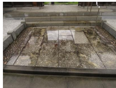
1. 黒カビや水垢の汚れ

のサビなのか、土等の汚れのしみ込みなのかテスト後にサビ抜き剤を全面に塗布して黄ばみが取れて、白御影石本来の白さが戻ってきました。