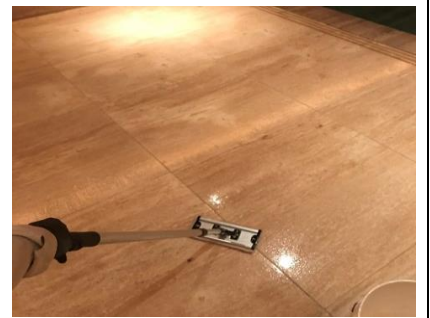
4. 浸透性の吸収防止剤塗布