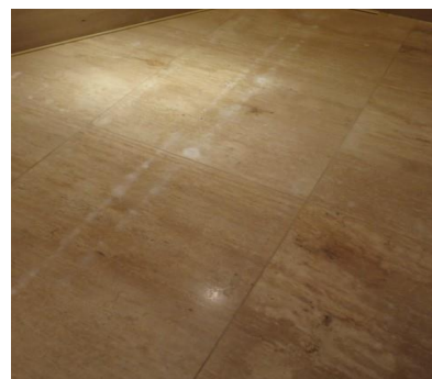
1. 大理石床の白い色抜け

翌日、浸透性の吸収防止剤をたっぷり塗布して完了します。施工後も同じ現象が起きるので、定期的に施工に入ることになりました。