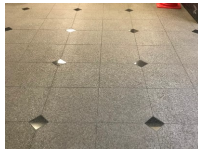
3. シミが抜けました