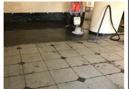
4. 全面洗浄で均一に仕上げる