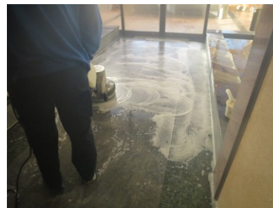
1. 防滑前の下地洗浄

出ていたのですが、実際裸足になって1枚ずつ確かめると、タイルによって効き目のムラがあるので、手直し部分にマークを付けて再度防滑処理をして完了となりました。