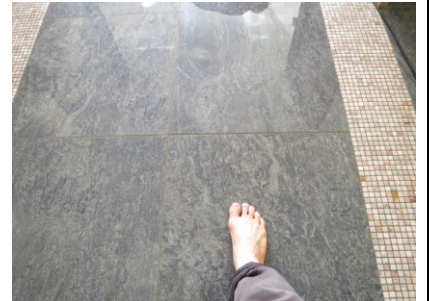
4. 1枚ずつ、裸足でチェック