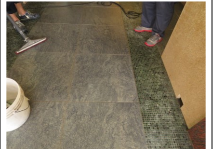
2. 防滑前にバキュームして乾燥