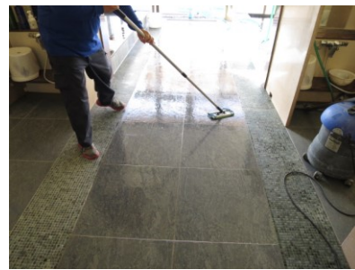
3. 防滑処理中乾燥させないのが肝