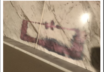
2. シミ抜きで反応を確認