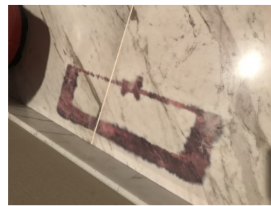
1. インクジェットのシミ

何回も湿布をしては、すすぎ乾燥を繰り返して、最終的には、全くというくらいに完全除去に至りました。ブラック系のインクが漏れていないことが幸いしました。