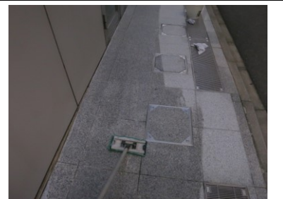
4. 御影石用保護剤塗布