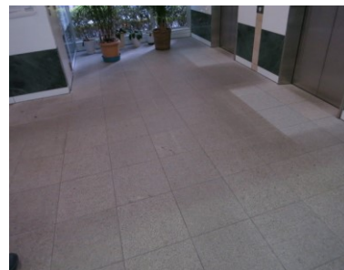
1. 洗浄前（マット下部が本来の色）

での清掃になります。乾燥後は、汚れが付いても洗いやすいように保護剤を塗布して完了しました。