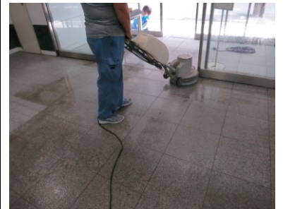
2. 酸性洗剤塗布後洗浄中