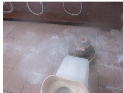
1. アルカリと酸洗浄を行う