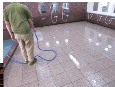
3. たっぷりの水で防滑剤をすすぐ