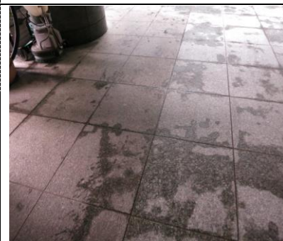
3. 半分洗浄後、緑色が蘇る