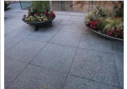
4. 薄緑色が蘇りました。