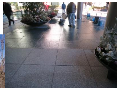
3. ポリッシャー洗浄中