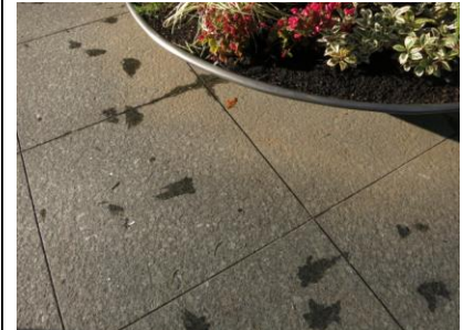
2. かなり茶色が目立っています