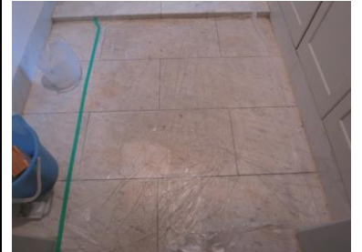
2. シミ抜き剤を湿布中