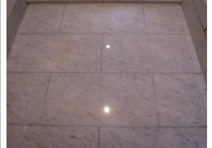
4. サビ抜き湿布後完了