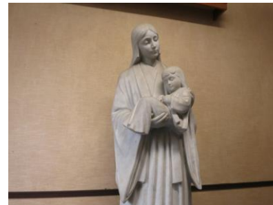
1. マリア様象 洗浄前

たら、ウエスで表面の水分を軽く取って、最後に漂白等の洗剤を全体的に塗布しました。翌日、最終的にチェックで軽い手直し施工をして完了しました。