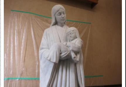
4. 洗浄完了・乾燥後