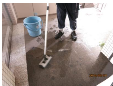
2. アルカリ洗浄剤塗布