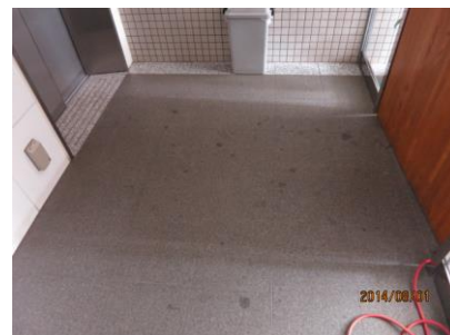
1. 床に付着したエアコン油シミ