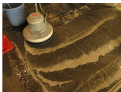
3. 全体の洗浄をする