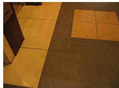
4. 油シミ抜き完了後