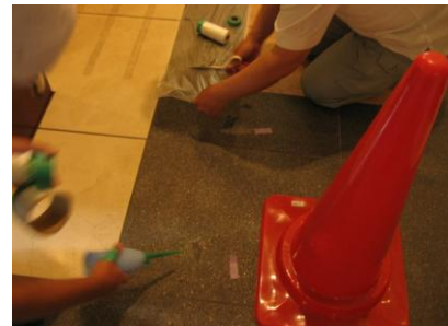
2. シミ抜き剤塗布 + 湿布