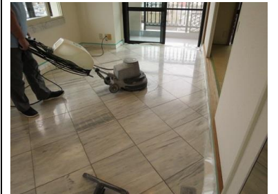
2. 下地処理テストから全体